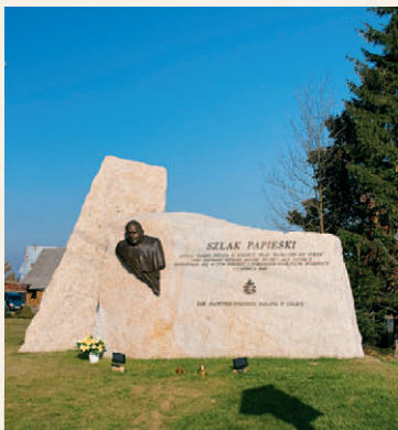
Pamiątkowy głaz w Zębie

Docieramy do wsi Ząb. „Najwyżej położona parafia w Polsce” – tak podpisali się wierni, którzy na pamiątkę przejazdu przez wieś papieża Jana Pawła II, postawili tu kamienny monument. Na kamieniu znalazły się jeszcze słowa: „Witaj Gazdo Świata w miejscu, skąd najbliższej do nieba”. Rzeczywiście, Ząb leżący na wysokości 1040 m n.p.m. jest najwyżej położoną wsią w Polsce. Warto podejść do drewnianego kościółka św. Anny z początku XX w., przy którym znajduje się stary cmentarz. Obsadzony limbami zapewnia ładny widok na Tatry. Dla fanów skoków narciarskich interesująca może się okazać informacja, że to właśnie w Zębie wychował się Kamil Stoch.