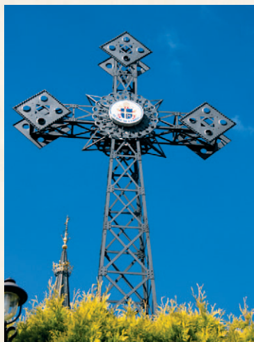
Krzyż na Krzeptówkach

Trasę można pokonać pieszo lub na rowerze. Decydując się na wędrowkę, trzeba pamiętać, że do przejścia jest sporo kilometrów. Alternatywą jest przejażdżka rowerowa, wówczas należy jednak wziąć pod uwagę kilka większych wzniesień, które znajdują się na trasie i które mogą dać się we znaki. Szlak ma oznaczenie „Droga papieska”. Są to białe litery na niebieskim tle ze złotym herbem papieskim.