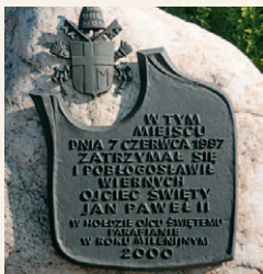
Kamień w Maruszyńce

Mijamy po prawej stronie budynek remizy strażackiej i docieramy do skrzyżowania obok kościoła Przemiana Pańskiego. Znajduje się tu pamiątkowy kamień uwieczniający przejazd przez wieś Jana Pawła II w 1997 r. Skracamy w prawo, w kierunku Ludźmierza.