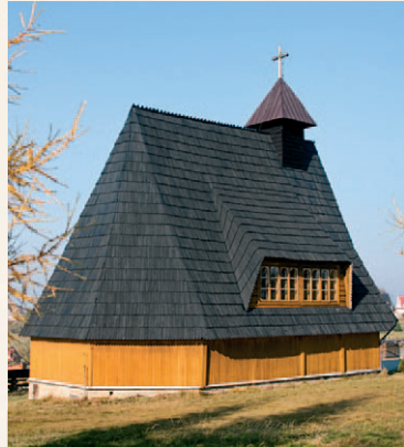
Kaplica św. Alberta

Droga idącą przez wieś jest wąska, ale dobrze utrzymana. Przed nami 3,5-kilometrowe podejście bądź podjazd. Rowerzystom prawie 7-stopniowe nachylenie drogi może przysporzyć nieco wysiłku. Gdy jednak dojedziemy na górę i skręcimy w lewo, będziemy się cieszyć długim, blisko 8-kilometrowym zjazdem. Tak docieramy do