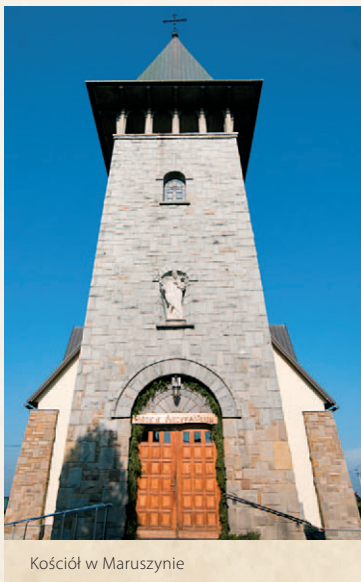
Kościół w Maruszyńce

Choć w historii Ludźmierza zapisało się wiele sławnych rodów, np. Tetmajerowie, którego Ludźmierz był rodzinną wsią, nie bez powodów miejsce znane jest głów-