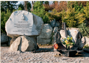
Pamiątkowy głaz na szlaku