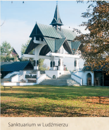
Sanktuarium w Ludźmierzu

Kult Matki Boskiej Ludźmierskiej trwa od XV w., choć żadne źródła nie wspominają w jakich okolicznościach cudowna figura pojawiła się w Ludźmierzu. Drewniana neogotycka statua Madonny z Dzieciątkiem znajduje się w ołtarzu głównym. Ubrana w złociste szaty Matka Boska dzierży w ręce berło, Dzieciątko trzyma natomiast w lewej dłoni królewskie jabłko, prawą zaś wykonuje gest błogosławieństwa. 15 sierpnia, w święto Gaździny Podhala, statua Matki Bożej otrzymała korony papieskie (Jana XXIII) z rąk prymasa Stefana Wyszyńskiego. W trakcie uroczystości homilię wygłosił biskup Karol Wojtyła. Powiedział wtedy: „[...] ta korona pozwoli nam bardziej niż dotąd nazywać ją Królową Podhala”. Insignia skradziono, nowe poświęcił Jan Paweł II na krakowskich Błoniach 22 czerwca 1983 r.