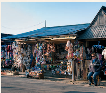
Kramy na Gubałówce

Furmanowa to kolejna miejscowość na trasie przejazdu papieskiego papamobile z zakopiańskiego sanktuarium na Krzeptówkach do sanktuarium w Ludźmierzu. Znajduje się tu kolejny pamiątkowy głaz.