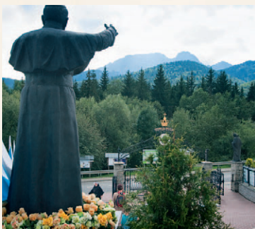
Jan Paweł II spogląda na Giewont

Sanktuarium Matki Bożej Fatimskiej na Krzeptówkach przyciąga każdego roku około 2 milionów wiernych. Obok Matki Bożej świątynia została poświęcona Janowi Pawłowi II – jest „wotum dziękczynnym za uratowanie życia Ojca Świętego” z zamachu 13 maja 1981 r. Znajduje się tu pomnik Ojca Świętego i ołtarz papieski przeniesiony spod Wielkiej Krokwi. Samo prezbiterium świątyni zbudowano w kształcie papieskiej tiary.