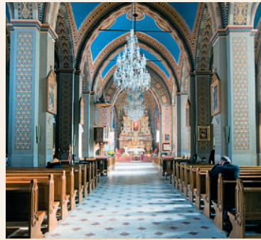
Wnętrze sanktuarium w Ludźmierzu

nicę, dwa dzwony oraz sygnaturkę. Stojący obok świątyni ołtarz połowy wzniesiono pod koniec XX w., podobnie jak drogę krzyżową, której poszczególne stacje mają oddzielnych fundatorów. Gdy w czerwcu 1997 r. papież odwiedził ludźmierską świątynię, powiedział: „Z podziwem patrzę na to sanktuarium, które się tak rozrosło i wy piękniało”. W 2001 r. Jan Paweł II podniósł kościół w Ludźmierzu do rangi bazyliki mniejszej.