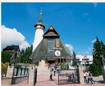
Sanktuarium na Krzeptówkach