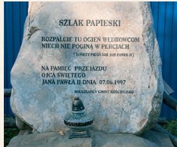
Pamiątkowa tablica na szlaku

Na pamiątkę przejazdu Jana Pawła II przez Kościelisko 7 czerwca 1997 r. mieszkańcy gminy przy współpracy z parafią św. Kazimierza Królewicza oznaczyli szlak Sursum Corda trzema pamiątkowymi głazami z tablicami, na których znalazły się fragmenty młodzieńczych sonetów Karola Wojtyły ze zbioru Renesansowy psalterz . W darze dla Jana Pawła II słowa oraz papieski herb wykuła młodzież z zakopiańskiej Szkoły Kenara. Do jednego z granitowych głazów przymocowano kotwicę – dar Polskiej Marynarki Wojennej ze Świnoujścia – symboliczne nawiązanie do słów Ojca Świętego: „Od Tatr aż do Bałtyku [...]: Sursum Corda! – W górę serca!”.